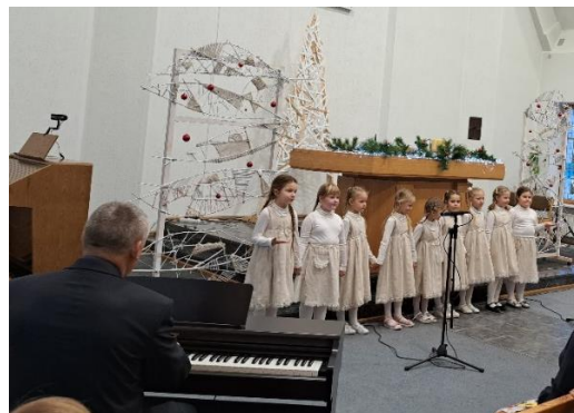
„Teskamba giesmės, sakralinės muzikos rytmetis... dalyvaujame nuo 2012 m.