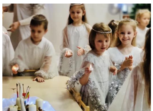
2023 m. atnaujinta LESYKLĖLIŲ ALĖJA - pastatytos ir sodo gyventojus džiugins 14 naujų lesyklėlių... Ačiū Tvarikiukams ir jų draugams...