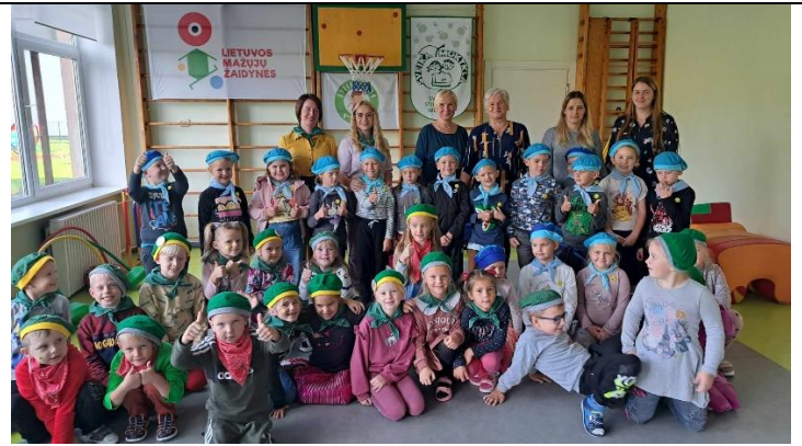
Nuo 1999 metų sėkmingai veikia vaikų savivaldos klubas „Tvarkiukas“