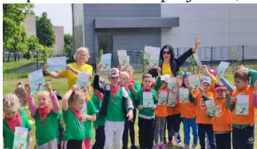
Ačiū „Obuoliukų“ ir „Pelėdžiukų“ komandoms...

9. „Mažasis futboliukas“, respublikinis FIFA projektas;