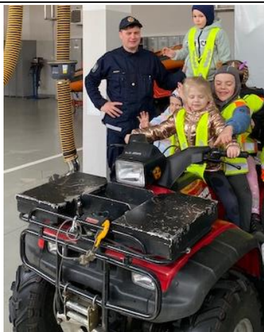
„Pažink profesijas“ - tėvų savanorystės projektas...